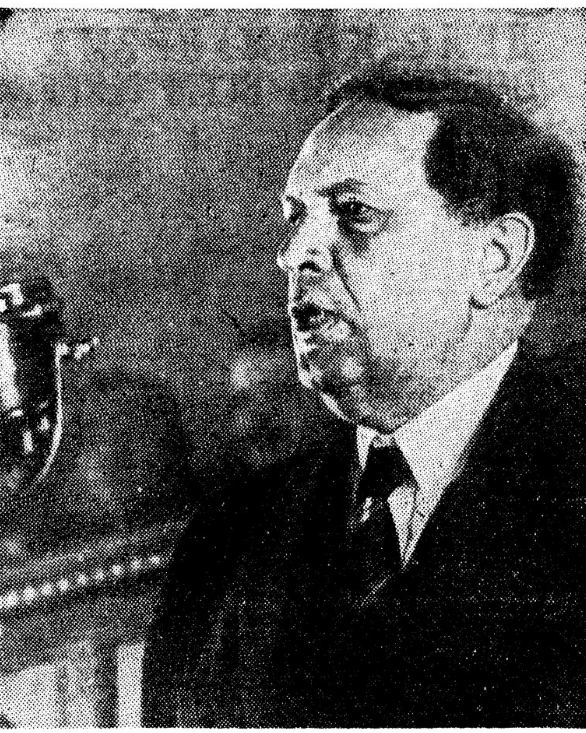
Выступление А. Н. Толстого в прениях по докладу тов. Сталина о проекте Конституции Союза ССР.